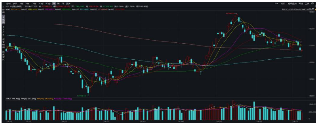
恆生指數日行情 (2023 11 17 - 2024 07 09)

相對於上一個月，2024年5月恆生指數跌2%報17718.61點，恆生金融指數跌2.17%報31431.35點，恆生公用事業指數跌0.89%報34201.35點，恆生地產指數跌8.55%報14801.23點，恆生工商業指數跌1.43%報9733.42點，恆生中國企業指數跌0.95%報6331.86點，恆生科技指數跌3.69%報3554.45點。