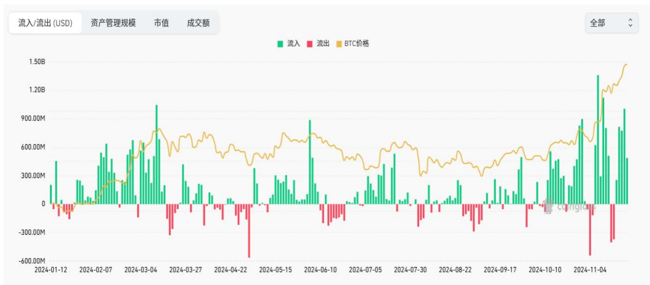
圖五：比特幣現貨 ETF 淨流入情況

從資金面來看，隨著多項利好加密貨幣的積極因素支持，加密貨幣市場資金流入持續轉好。根據 Coinglass 的數據顯示，從 11 月 18 日至 11 月 22 日比特幣 ETF 資金在持續淨流入，淨流入量達到 33.4 億美元，相較前一周的資金流入量增長了 1 倍，反映出市場對比特幣的需求在顯著提升。ETF 的資金流入大幅增長代表主流金融市場對比特幣的逐步接納和認可，以及投資者對比特幣的信心在持續提升。認為特朗普當選後使市場預期後續將有望推出多項支持加密貨幣行業的政策，投資者對比特幣的需求預計會逐步增強。隨著後續比特幣 ETF 資金的持續淨流入，將有望推動比特幣價格進一步上升。