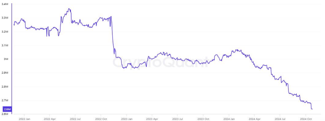
圖七：比特幣在交易平臺的供應量情況

從交易所比特幣數量來看，比特幣在加密貨幣交易平臺上的存量逐漸減少，這一現象暗示著投資者更傾向於長期持有比特幣，而非頻繁買賣。根據 CryptoQuant 的統計，交易所所持有的比特幣數量已經下降至大約 258 萬枚，相較於 2021 年牛市頂峰時期有了顯著的減少。認為交易所比特幣供應量的減少給買家帶來了壓力，因為可供交易的比特幣數量正在減少。隨著可供出售的比特幣數量減少，如果市場需求保持穩定或增長，比特幣的價格上升趨勢可能會持續。這也反映出，在當前全球經濟政策的不確定性和通貨膨脹率上升的背景下，投資者對比特幣作為一種保值資產的信心正在增強。