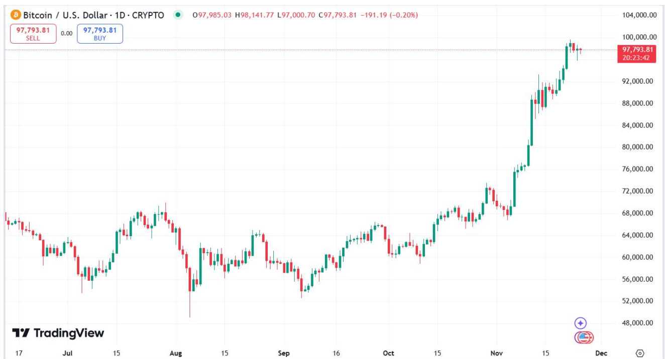
圖一：比特幣價格情況

上周加密貨幣市場繼續迎來較強勁的上漲勢頭。比特幣價格上周漲幅達到 9% 達到 97985 美元，顯示出強勁的多頭趨勢。與此同時，隨著 ETF 資金的持續流入，比特幣的市場情緒依舊保持樂觀。以太坊的價格亦漲 9.4% 升至 3365.16 美元。根據 TradingView 數據，截至 2024 年 11 月 24 日全球加密貨幣市值達 3.27 萬億美元，上周漲幅達 10.76%。