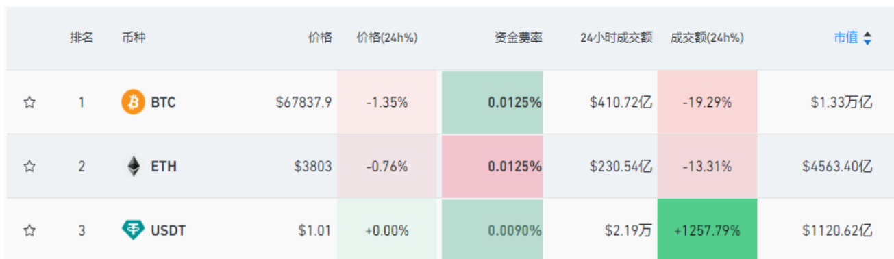
圖二：市值排名前三的加密貨幣情況

在以太坊現貨 ETF 獲批前夕，多家機構和分析師均對此後的市場做出相關預測。目前市場普遍認為，以太坊現貨 ETF 的獲批，將進一步幫助比特幣、以太坊等加密貨幣觸達更大資金面，更便於投資者將更多資金投入到比特幣、以太坊等新興的資產類別中。彭博 ETF 分析師 James Seyffart 表示，當前比特幣的總市值約為 1.3 萬億美元，以太坊市值約為比特幣的 30%，由此預測，上市後現貨以太坊 ETF 的需求可達到現貨比特幣 ETF 的 25% 左右。