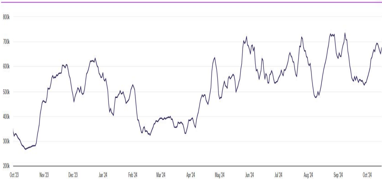
圖七：比特幣網路交易量情況