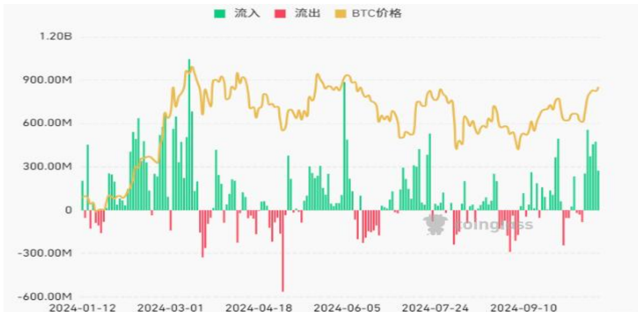
圖五：比特幣現貨 ETF 總淨流入情況

從資金面來看，隨著多重利好因素積累，看漲情緒已重回加密貨幣市場。美國現貨比特幣 ETF 市場近期持續出現正向的資金流入，根據 Coinglass 的數據顯示，截至10月18日，比特幣現貨 ETF 連續七天淨流入保持正增長，10月11日至10月18日這一週淨流入約為 24 億美元，較之前一周的資金流入量數據改善幅度較大。這表明投資者對比特幣的需求在逐步增強，市場情緒也在逐漸變好，隨著資金的不斷注入，將有望支撐比特幣價格並有望推動其進一步上升。