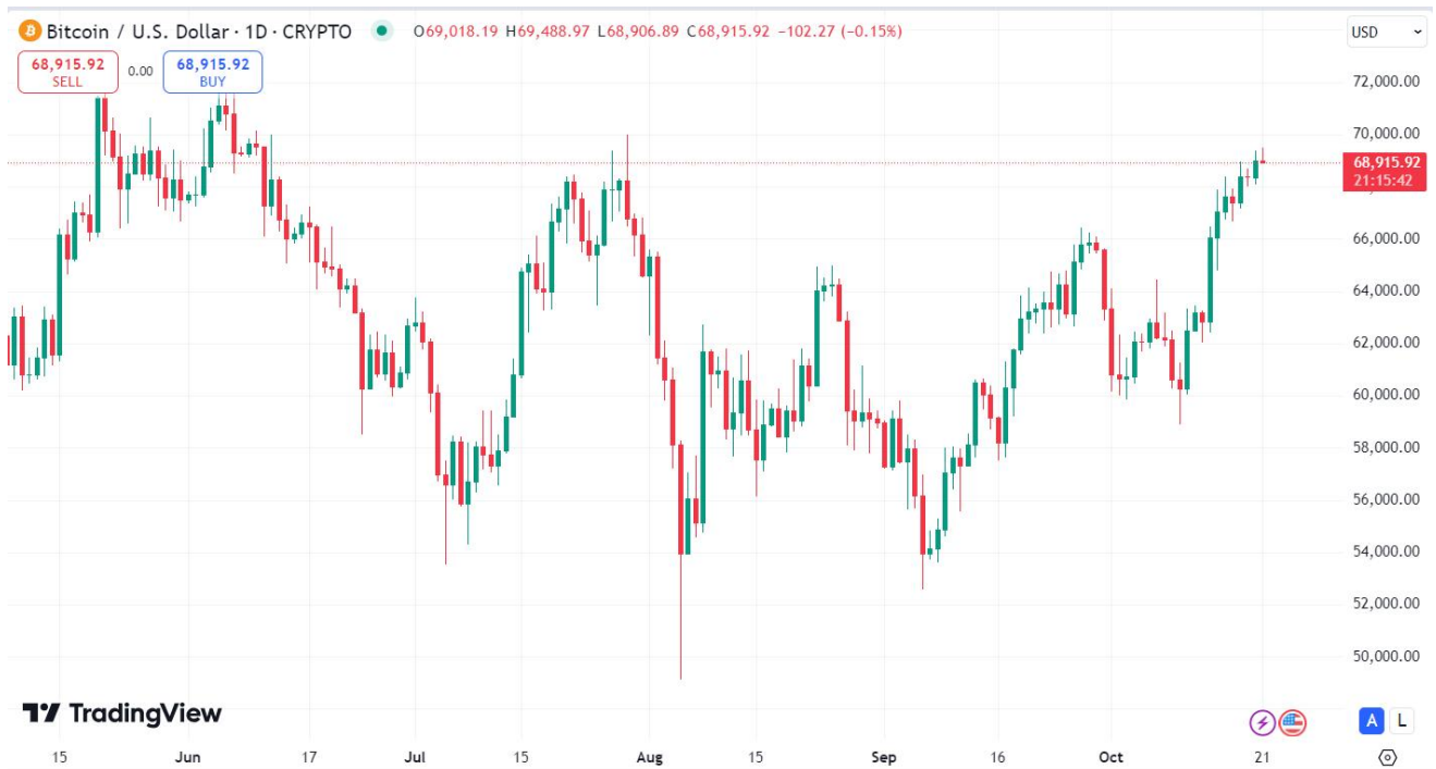
圖一：比特幣價格情況

上周，加密市場迎來了令人矚目的反彈勢頭。比特幣價格上周漲幅達到 9.8% 突破 68000 美元，以太坊的價格亦漲 7.5% 升至 2640 美元。根據 TradingView 數據，截至 2024 年 10 月 20 日全球加密貨幣市值達 2.33 萬億美元，較月初上漲 8.9%，加密貨幣市場開啟全線上漲模式。