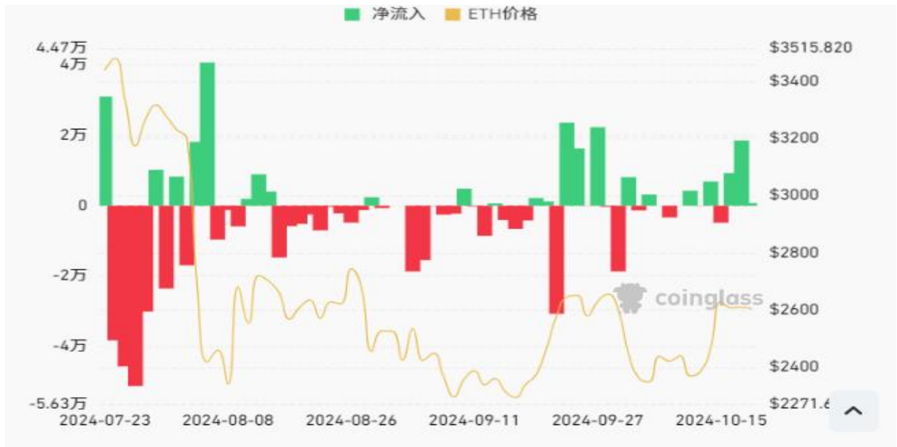
圖六：以太坊 ETF 資金流入情況

在以太坊方面，根據 Coinglass 的數據，從 10 月 11 日到 10 月 18 日的一周內，以太坊現貨 ETF 的淨流入為 7880 萬美元。雖然是正向淨流入，但與比特幣現貨 ETF 高達 24 億美元的淨流入相比，以太坊的表現則顯得較為遜色。特別是在上周二以太坊現貨 ETF 資金出現了淨流出情況，這表明投資者對該資產的信心仍有波動。這可能反映了投資者目前更傾向於關注比特幣的市場動能，並將資金優先配置於表現強勢的比特幣。然而，以太坊的長期潛力仍然不容忽視，尤其是隨著 Layer 2 解決方案的發展和以太坊生態系統的持續擴張，預計其後市仍有顯著的增長潛力。短期內，以太坊現貨 ETF 的表現可能會受到整體加密市場情緒和資金流向的影響，但未來潛在的基礎設施升級和 DeFi 領域的發展將繼續為以太坊帶來持續的需求和支持。